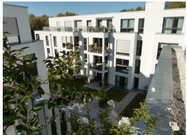
Terrasse zum Innenhof